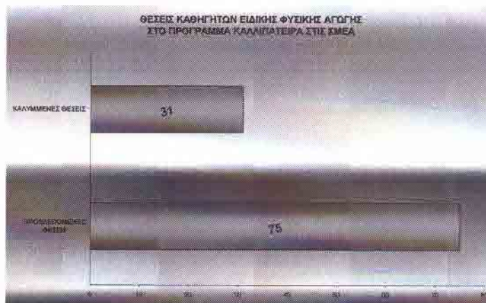
Σχήμα 3: Κάλυψη θέσεων Κ.Φ.Α. στις Σ.Μ.Ε.Α. για το πρόγραμμα Ολυμπιακής Παιδείας

Από την έρευνα σχετικά με την υλοποίηση του απερχόμενου προγράμματος Ολυμπιακής Παιδείας στις Σ.Μ.Ε.Α. προέκυψε ότι από τις 75 προβλεπόμενες θέσεις αναπληρωτών καθηγητών Ειδ.Φ.Α. στις Σ.Μ.Ε.Α. για το πρόγραμμα της Ολυμπιακής Παιδείας μόνο 31 καθηγητές εντάχθηκαν στο διδακτικό προσωπικό, ποσοστό 41,3% (Γράφημα 3). Φαίνεται ότι η στήριξη του προγράμματος της Ολυμπιακής Παιδείας για τους μαθητές με ειδ.ε.α. δεν ήταν ισότιμη με τη στήριξη του προγράμματος των άλλων συμμαθητών τους.